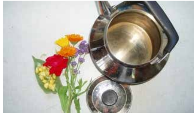
Koka ihop din egen härtvätt!