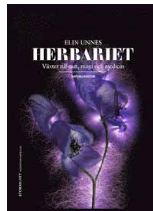
Herbariet kommer under våren 2016.

Som kuriosa kan nämnas att koloniområdet räknas till Djurgården och att marken tillhör kungen. Elin Unnes ställde sig i kö nästa dag och började läsa allt hon kom över om odling.