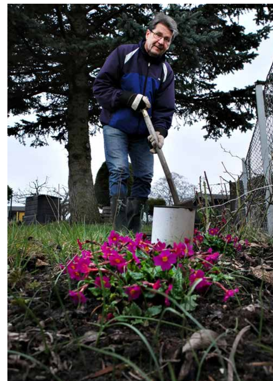
Man vet aldrig vad man hittar när man gräver. Följ Lyckligt Lottads egen följetong, Döden på Magnolian, som är författad av Arne Svensson, kolonist på Östra Sommarstaden i Malmö.

– Det har ju varit ett riktigt mord här på Östra Sommarstaden för ett antal år sedan. Då var det någon som hade lånat en stuga och senare hittade man en person mördad och nedgrävd i trädgården. Det sätter fart på fantasin. Sedan tycker jag om att cykla och hämta in stämning-