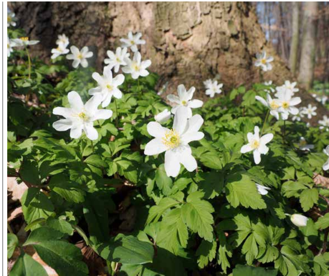
Vitsippor - en av många växter som tidigt skvallrar om att våren är här.

■ 21-24 april arrangeras Nordens största trädgårdsmässa, Nordiska Trädgårdar, på Stockholmsmässan. Drygt 50 000 besökare väntas till de runt 400 utställarna. Under mässan kommer bland annat svenska mässterskapen i blomsterbinderi att avgöras.