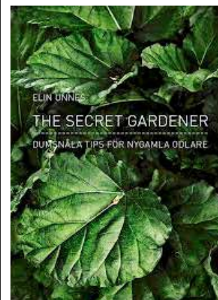
The Secret Gardener kom 2014.