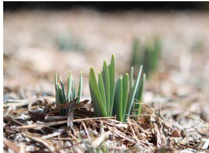
Nu spirar det i rabatterna.

Som vanligt blir vi på Lyckligt Lottad glada när ni hör av er och berättar vad som är på gång, såväl på koloni- och odlingsområdena som i den egna ortgården. Vi går nu in på vår andra säsong som kolonisternas och stadsodlarnas stugorgan, och även vi har botaniserat i de idémässiga fröpåsarna. Det kommer att synas i tidningens reportage framöver, där vi kommer att bjuda på mycket nytt.