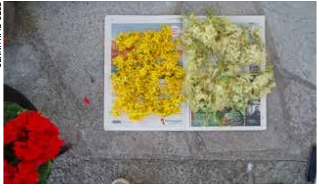
Johannesört och älggräs - dekorativa.

"Jag älskar att cykla hem med cykelkorgen fylld med egenodlade grönsaker. Då känner jag mig verkligen stolt."